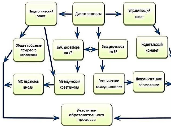
Структура и органы управления образовательной организацией

Краткие сведения о реализуемых образовательных программах, образовательных технологиях, особенностях обучения, воспитания и дополнительного образования.